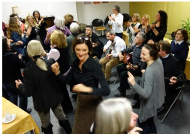
DUO-Freiwillige begrüßen tanzend das Neue Jahr!

DUO – Schöne Stunden für Menschen mit Demenz, ein Kooperationsprojekt der Kölner Freiwilligen Agentur und des ASB Köln, vermittelt engagierte Freiwillige, die Menschen mit Demenz in Ihrer häuslichen Umgebung besuchen und Zeit mit Ihnen verbringen.