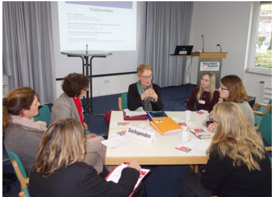
Diskussion unter den Teilnehmenden.