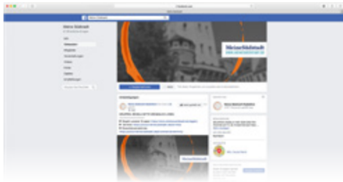
Die Facebook-Gruppe zur Seite »Meine Südstadt«