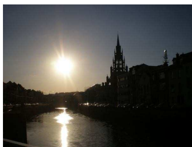
(River Lee und Trinity Church)

Das YIC war mein Hauptprojekt, und ich sollte dort vier Tage pro Woche arbeiten und an einem Tag durfte ich mich an anderen Projekten des YMCA beteiligen. Da es aber im YIC oft nicht viel zu tun gab, war es mir in den ersten Monaten oft langweilig, was ich schlimm fand, weil ich mich doch entschlossen hatte, etwas sinnvolles zu tun !