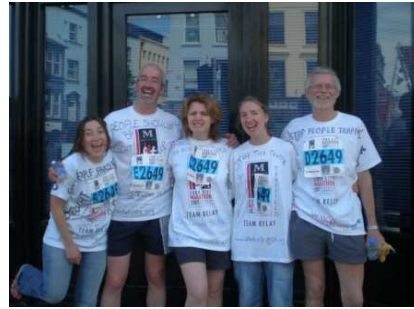
Unser 'Stop Slavery' Team (im Ziel nach 3h58min)